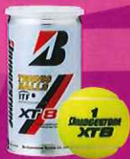
大会使用球 ブリヂストンXTB